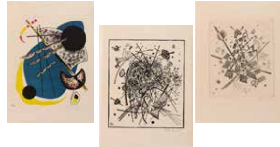
5-6-7 - Wassily Kandinsky, Petits Mondes I , 1922, estampes en couleur, Paris, Centre Pompidou, Musée national d'art moderne / Centre de création industrielle

Victor Hugo est contraint à l'exil dans les îles anglo-normandes de Jersey et Guernesey entre 1852 et 1870. Ce dessin de lavis* d'encre brune réalisé en 1857, rehaussé de gouache blanche appliquée au pinceau et à la plume sur vélin suggère par une forme elliptique l'amplitude et la force des éléments qui portent l'embarcation. Le spectacle de la nature fascine l'écrivain. La contemplation de cet univers marin dans lequel se retrouvent l'océan et les hommes à travers tempêtes et naufrages va nourrir ses approches poétiques et littéraires. Les atmosphères lourdes et les profondes obscurités de ses petites compositions témoignent d'une observation rigoureuse et attentive des manifestations de la nature. Il expérimente dans ses nombreux dessins qu'il offrirait à son entourage, des techniques inédites à la mesure de son génie créatif en mixant l'encre et le café noir, en broyant du charbon ou de la suie de cheminée allant même jusqu'à l'application de jus de fruits rouges.