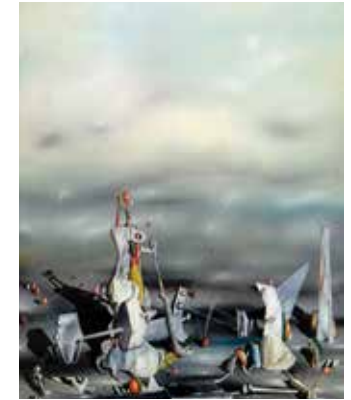
8 - Yves Tanguy, Le palais aux rochers de fenêtres , 1942, huile sur toile, Paris, Centre Pompidou, Musée national d'art moderne / Centre de création industrielle

Petit Monde I est un portfolio* composé d'un texte et d'images. Cette succession de compositions abstraites très graphiques sur le fond clair du papier se compose de douze estampes : six lithographies, quatre pointes sèches et deux bois gravés. Cette suite basée sur un jeu vibrant de lignes et de formes enchevêtrées est à l'origine du langage spirituel de cet artiste qui très jeune était aussi fasciné par le pouvoir des couleurs. Réalisée peu de temps après son entrée au Bauhaus, chaque dessin représente la reconstitution d'un microcosme autonome issu de la vision que l'artiste portait sur le monde et le cosmos. Les techniques utilisées sur pierre, bois et cuivre produisent des effets variés aux propriétés symboliques fortes. Les épreuves lithographiées ressemblent à des petites peintures (5). Dans les bois gravés, les textures et les effets de profondeur sont davantage exploités (6) et des lignes dessinées, nettes et limpides caractérisent les compositions aérées issues des pointes sèches (7).