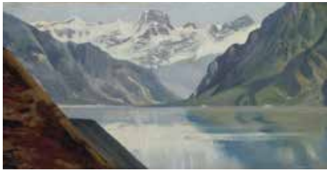
4 - Achille Etna Michallon, Lac et montagnes , 1821, huile sur papier, Musée du Louvre, Paris

La ligne d'horizon est une ligne imaginaire qui sépare le ciel et la terre. Un horizon au premier tiers du tableau correspond à peu près à un observateur situé au même niveau que ce qu'il regarde. Haut placée, elle signifie que le spectateur est au-dessus dans une vue plongeante sur le paysage.