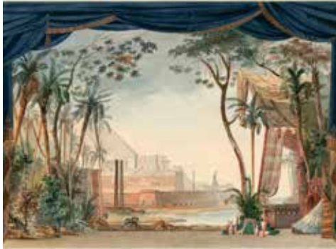
7 - Auguste CARON, Moïse : esquisse de décor , 1827, aquarelle et crayon, Paris, Bibliothèque-musée de l'Opéra