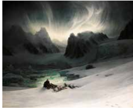
6 - François-Auguste Biard, Magdalena Bay, vue prise de la presqu'île des tombeaux, au nord du Spitzberg; effet d'aurore boréale , 1841, huile sur toile, Paris, Musée du Louvre

Natif de Haarlem, Pieter Mulier II (1637-1701) gagne l'Italie tout jeune adulte vers 1656 pour ne plus jamais quitter la péninsule. Présent surtout à Gênes et à Milan, il mène une belle carrière sous le nom évocateur d' Il Tempesta . Il se fait en effet une spécialité des scènes de mer démontée qu'il exécute souvent selon un dispositif théâtral bien rôdé. La multiplication des navires peut ainsi se lire comme la narration d'un inéluctable naufrage selon une diagonale partant de la ligne d'horizon à gauche et s'achevant dans le coin inférieur droit par les trois infortunés marins jetés à l'eau par les récifs. La tour qui se dresse sur un promontoire rocheux fonctionne alors comme un contrepoint à la fragilité des navires. Une seconde diagonale est matérialisée par l'éclair qui jaillit des nuées et place le tragique de la scène sous le signe du châtime divin.