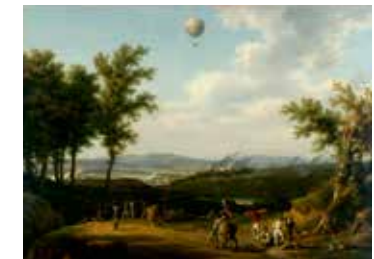
10 - Louis-François Lejeune, Siège et embrasement de Charleroi, le 7 Messidor An II (25 juin 1794) , 1795, huile sur toile, Musée de l'Armée, Paris