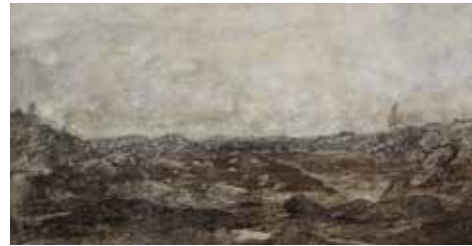
5 - Théodore Rousseau, Les Gorges d'Apremont , huile sur toile, Musée des Beaux-Arts, Palais de l'Evêché, Limoges