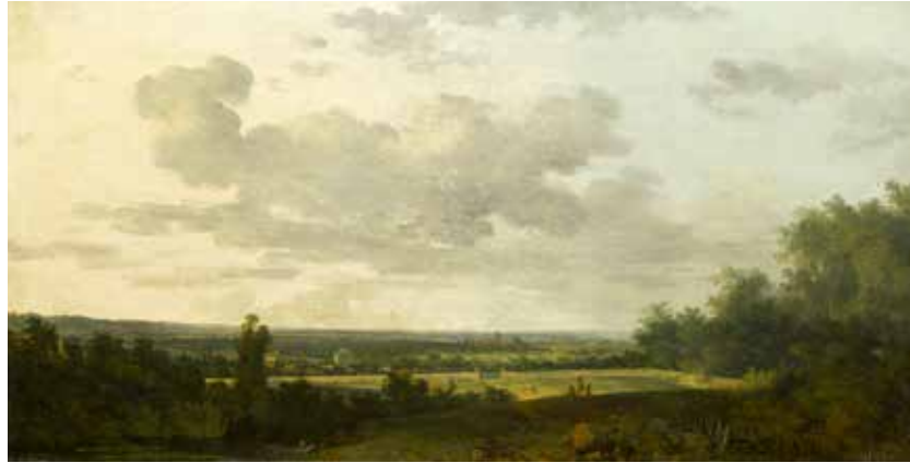
5 – Louis Gabriel Moreau, Vue du château de Vincennes prise des hauteurs de Montreuil , 1750-1800, huile sur toile, Paris, Musée du Louvre

La popularité des vedute * à partir de la seconde moitié du 18 e siècle développe l'intérêt des artistes pour la restitution de la physionomie d'un lieu, pour la réalisation d'un « paysage-portrait » selon la formule inventée par Pierre-Henri de Valenciennes en 1800, dans lequel la ressemblance prime. Appréciations esthétiques et considérations logistiques amènent à choisir le proche comme un sujet de peinture. À l'image de Louis-Gabriel Moreau (5), plusieurs peintres vont ainsi investir les environs de Paris, traçant se faisant des voies poursuivies au siècle suivant.