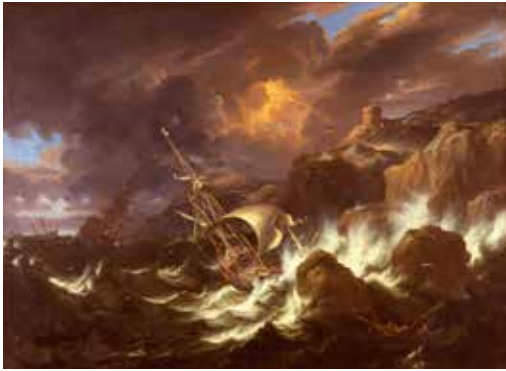
5 - Pieter Mulier II, Tempête sur la mer avec un vaisseau jeté sur les récifs , vers 1684-1701, huile sur toile, Amiens, Musée de Picardie

La place des manifestations extrêmes de la nature dans la peinture doit beaucoup à l'influence des peintres du Nord. Le paysage idéalisé qui s'impose en Italie au 17 e siècle orientait davantage les peintres vers l'évocation d'un lieu idyllique limitant les dérèglements atmosphériques. La nation hollandaise en revanche, aux prises avec la mer du Nord, notamment dans la création de polders, s'est montrée plus sensible à la rivalité titanesque que les hommes livraient à l'étendue marine. Ainsi, des artistes comme Pieter Mulier II popularisent au 17 e siècle les scènes de tempêtes dans le reste de l'Europe (5). Les évocations d'une nature spectaculaire – chaos alpins ou éruptions volcaniques – selon le goût pour le sublime* du 18 e siècle, sont amplifiées par le mouvement romantique au tournant du 19 e siècle. Les vues cataclysmiques fragilisant la figure humaine sont emblématiques de la manière dont les artistes renouvellent le genre du paysage (6). Il est séduisant d'y voir un parallèle avec les incertitudes d'une période de forts bouleversements politiques – périodes révolutionnaire puis napoléonienne – et sociaux – première révolution industrielle.