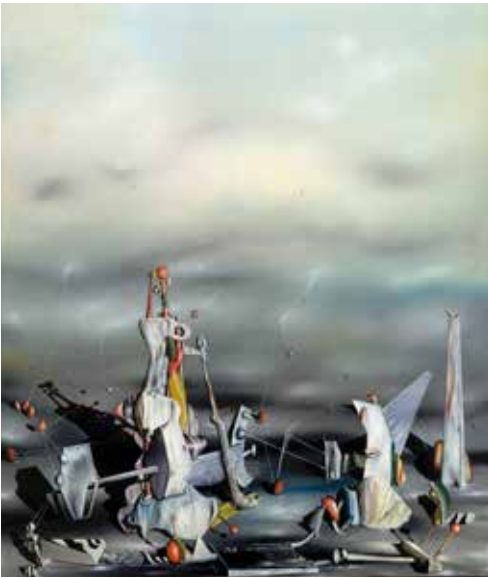
24 - Yves Tanguy, Le palais aux rochers de fenêtres , 1942, huile sur toile, Paris, Centre Pompidou, Musée national d'art moderne / Centre de création industrielle

Les artistes installent des images étonnantes. Ils souhaitent montrer un paysage qui reflète leur vision d'un monde intime. Les surréalistes y mettent en scène leurs rêves. Kandinsky prend appui sur le paysage pour s'élancer dans l'abstraction. Joan Mitchell ne cherche pas à représenter mais à transposer ses sensations éprouvées face à la nature.