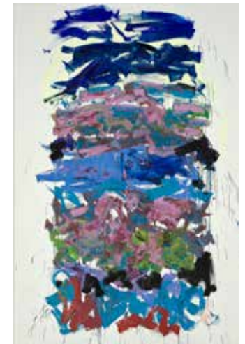
9 - Joan Mitchell, Champs , 1990, huile sur toile, Paris, Centre Pompidou, Musée national d'art moderne / Centre de création industrielle