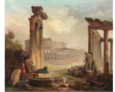
11 - Hubert Robert, Ruines romaines avec le Colisée , vers 1761-1764, huile sur toile, Paris, Musée du Louvre

Dans cette pastorale amoureuse, genre duquel François Boucher tire sa renommée, la nature semble faite pour l'homme et ses actions joyeuses. Les teintes lumineuses des habits au premier plan font ainsi écho au paysage verdoyant qui se dégage sur la droite. Boucher s'inscrit dans une tradition bien ancrée du cadre champêtre comme lieu privilégié de l'amour qu'il renforce toutefois par la force de la composition. Les figures blotties dans la nature font de cette dernière plus qu'un aimable décor. Le paysage agit comme le reflet du sentiment amoureux et, ce faisant, acquiert une dimension poétique.