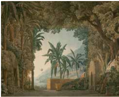
8 - Jean-Thomas THIBAUT, Elisca ou l'amour maternel : esquisse de décor , 1799, aquarelle et plume, Paris, Bibliothèque-musée de l'Opéra

Si le lieu scénique offre un cadre tout trouvé à la représentation de paysages, ces derniers n'en demeurent pas moins subordonnés à la nature du sujet représenté selon un principe de convenance. Ce décor du Moïse de Rossini correspond aux codes de la scène tragique avec un imposant collage de palais et de pyramides qui sièent à l'évocation d'un épisode biblique. Pour l'opéra-comique Elisca en revanche, dont la scène se joue sur l'île de Madagascar, le décor est fidèle aux règles de la scène satyrique convenant aux sujets moins nobles. La représentation d'une nature sauvage est ainsi redoublée par un exotisme de convention avec palmiers et cabanes rudimentaires.