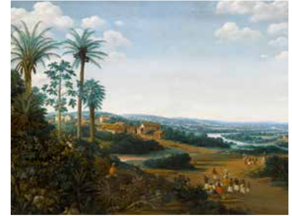
6 – Frans Post, « La demeure d'un labradoror » ( plantation de canne à sucre ), 1650-1655, huile sur toile, Paris, Musée du Louvre

Influencé par la culture visuelle hollandaise du 17 e siècle, Louis-Gabriel Moreau (1740-1806) affiche une prédilection pour une Île-de-France très peu représentée jusqu'alors. La ligne d'horizon abaissée profitant de l'ouverture du format et le point de vue surplombant concourent à l'étagement clair de plans parallèles soulignés par les variations sur les valeurs du vert. Le chemin qui se déploie depuis le premier plan insiste sur le caractère parcourable de cet espace. L'œil du spectateur peut y rencontrer différents éléments authentiques témoignant d'un souci d'exactitude topographique : le donjon du château de Vincennes, l'imposante demeure du compositeur Nicolas Dalayrac ou bien encore le couvent des Minimes dont le clocher émerge des arbres à l'extrême gauche. Face à cet espace terrestre soigneusement décrit, le ciel – dominé par d'imposantes masses nuageuses – apparaît un immense espace sans repères fixes, voué aux mouvements des vents. L'unité des tons entre la terre et le ciel suggère toutefois une continuité de l'un à l'autre dans cet espace ouvert. Edmond et Jules de Goncourt verront de ce fait en Moreau « l'un des inspirateurs de la couleur future du paysage anglais » 3 , manifeste notamment chez John Constable (1776-1837).