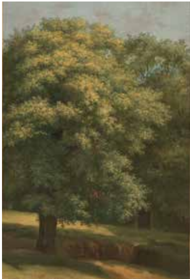
1 - Pierre Henri de Valenciennes, Le grand arbre , 1800-1825, huile sur papier collé sur carton, Paris, Musée du Louvre