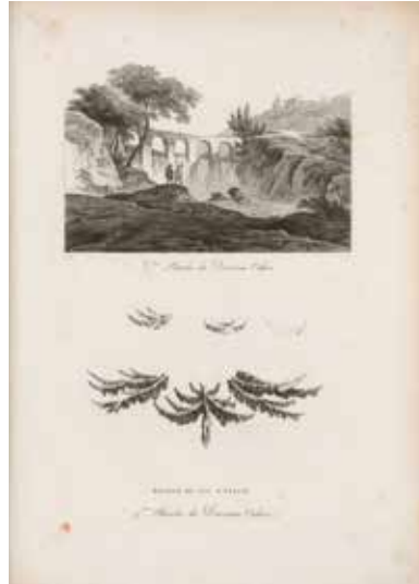
6 - Nicolas-Alphonse-Michel Mandevare, Principes raisonnés du paysage, à l'usage des écoles des départements de l'empire français , 1804, Paris, Bibliothèque nationale de France

Katsushika Hokusai est un observateur sensible au mouvement du monde. En 1811, il entame un périple de 8 ans à travers le Japon. Ce voyage lui permet de saisir par le dessin les scènes de la vie quotidienne mais également de procéder au relevé de la faune et de la flore locale, qu'il se propose de reproduire le plus fidèlement possible dans des carnets. Dans cette double page issue de la Manga , il compare la diversité des feuillages d'arbres et les formes étonnantes des troncs observés dans les sites traversés. Manga qui signifie « image sans but » qualifie des images autonomes mises en commun sans correspondance ou logique narrative particulière. Il rassemble cette vaste collecte dans le but ultime de la partager. Les ornements du paysage qui l'inspirent et l'enrichissent apparaissent sous la forme de dessins en noir, blanc et rose clair (plus de 3900 !). Il parvient à conserver la mémoire des lieux explorés et à diffuser dans cette iconographie l'atmosphère du Japon de son époque. Publié entre 1815 et 1878, ce recueil eut un succès important en Occident.