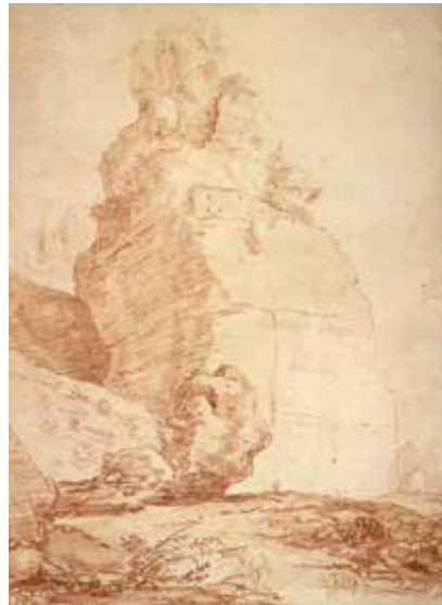
2 - Hubert Robert, Le Rocher de Terracina (titre forgé), 1760, sanguine sur papier, Paris, École nationale supérieure des beaux-arts