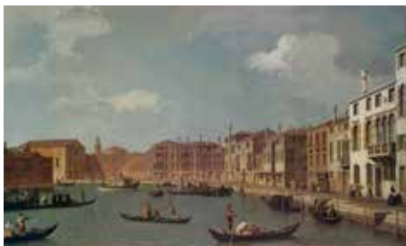
13 - Giovanni Canal dit Canaletto, Vue du canal de Santa Chiara, à Venise , vers 1730, huile sur toile, musée Cognac-Jay, Paris

La perspective linéaire et la perspective atmosphérique sont des techniques utilisées par les peintres pour suggérer la profondeur. Elles sont souvent combinées l'une à l'autre pour une plus grande efficacité. Quelques procédés peuvent permettre de représenter la profondeur dans une œuvre.