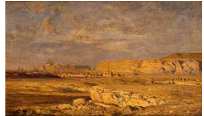
8 - Léon Belly, La Citadelle de Mokatan, près du Caire , vers 1856, huile sur toile, Paris, musée d'Orsay

Peintre majeur du courant orientaliste* français, Prosper Marilhat (1811-1847) effectue un long séjour au Levant et surtout en Égypte entre 1831 et 1833. De ce voyage il ramène de nombreux dessins dans lesquels il puisera pour composer ses toiles. Cette Vue du Nil ne doit en effet pas être prise pour une veduta * du siècle précédent. Marilhat y réalise plutôt un collage d'éléments évocateurs : minarets et coupoles servent de décor au passage des chameaux. La recherche du pittoresque s'arrête toutefois là puisque ce sont la lumière et l'eau qui sont les sujets de ce tableau. L'effet de soleil couchant diffuse ainsi une douce lumière qui harmonise la scène par des tons rosés, unité renforcée par les reflets du Nil. Les ombres douces et le pastel des teintes sont des moyens pour le peintre de rendre compte de la transparence de la lumière d'Orient.