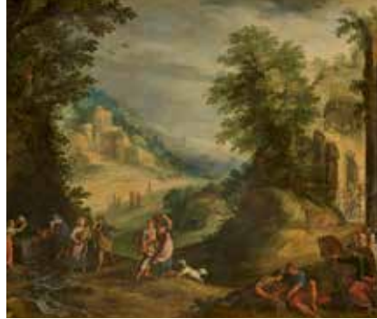
9 - Paul Bril, Paysage avec Eliézer et Rébecca , vers 1590-1600, huile sur toile, Paris, Musée du Louvre

Si le lieu scénique offre un cadre tout trouvé à la représentation de paysages, ces derniers n'en demeurent pas moins subordonnés à la nature du sujet représenté selon un principe de convenance. Ce décor du Moïse de Rossini correspond aux codes de la scène tragique avec un imposant collage de palais et de pyramides qui sièent à l'évocation d'un épisode biblique. Pour l'opéra-comique Elisca en revanche, dont la scène se joue sur l'île de Madagascar, le décor est fidèle aux règles de la scène satyrique convenant aux sujets moins nobles. La représentation d'une nature sauvage est ainsi redoublée par un exotisme de convention avec palmiers et cabanes rudimentaires.