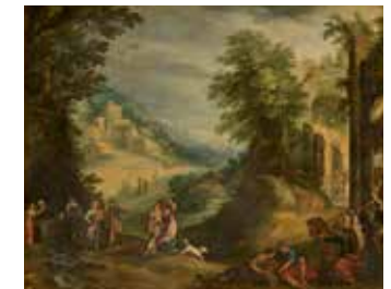
23 – Paul Bril, Paysage avec Eliézer et Rebecca , 1590-1600, huile sur toile, Musée du Louvre, Paris