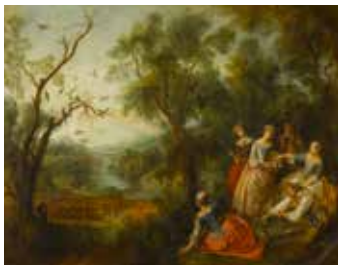
19 – Nicolas Lancret, Le Printemps , 1738, huile sur toile, Musée du Louvre, Paris

Le sujet de l'œuvre : est-ce un paysage champêtre, la représentation d'une nature simple et sans artifice ? Ou un paysage héroïque qui montre ce qu'il y a de plus majestueux dans la nature ?