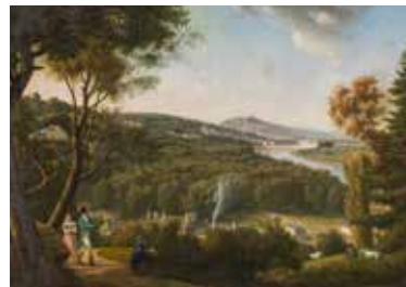
21 – Alexandre Hyacinthe Dunouy, St Cloud et la Seine vus de la hauteur de Brimborion à Sèvres , huile sur toile, Musée de l'Ile-de-France, Sceaux