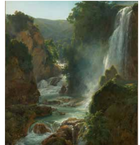
4 - Achille-Etna Michallon, La cascade (Tivoli) , 1821, huile sur toile, Paris, Musée du Louvre