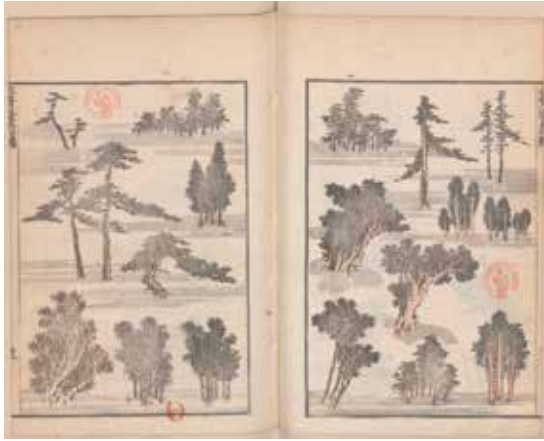
5 - Katsushika Hokusai, Hokusai manga , 1814-1878, Paris, Bibliothèque nationale de France

Katsushika Hokusai est un observateur sensible au mouvement du monde. En 1811, il entame un périple de 8 ans à travers le Japon. Ce voyage lui permet de saisir par le dessin les scènes de la vie quotidienne mais également de procéder au relevé de la faune et de la flore locale, qu'il se propose de reproduire le plus fidèlement possible dans des carnets. Dans cette double page issue de la Manga , il compare la diversité des feuillages d'arbres et les formes étonnantes des troncs observés dans les sites traversés. Manga qui signifie « image sans but » qualifie des images autonomes mises en commun sans correspondance ou logique narrative particulière. Il rassemble cette vaste collecte dans le but ultime de la partager. Les ornements du paysage qui l'inspirent et l'enrichissent apparaissent sous la forme de dessins en noir, blanc et rose clair (plus de 3900 !). Il parvient à conserver la mémoire des lieux explorés et à diffuser dans cette iconographie l'atmosphère du Japon de son époque. Publié entre 1815 et 1878, ce recueil eut un succès important en Occident.