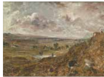
8 - John Constable, Vue de Hampstead Heath, environs de Londres, effet d'orage ou L'Étang de Branch Hill à Hampstead , vers 1882, huile sur toile, Musée du Louvre, Paris