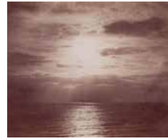
6 - Gustave Le Gray, Effet de soleil dans les nuages - Océan , vers 1861, épreuve sur papier albuminé à partir d'un négatif sur verre, Musée d'Orsay, Paris