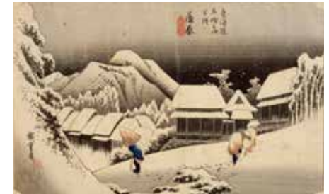
18 – Utagawa Hiroshige, 16 e vue : Kambara, nuit par temps de neige, Les cinquante-trois relais du Tōkaidō , estampe, Musée national des arts asiatiques Guimet, Paris

La présence des hommes : quel est le type de paysage ? Est-il sauvage ou habité ? Y-a-t il des personnages ? Quelle est leur taille ? Qui sont-ils ? Que font-ils ?