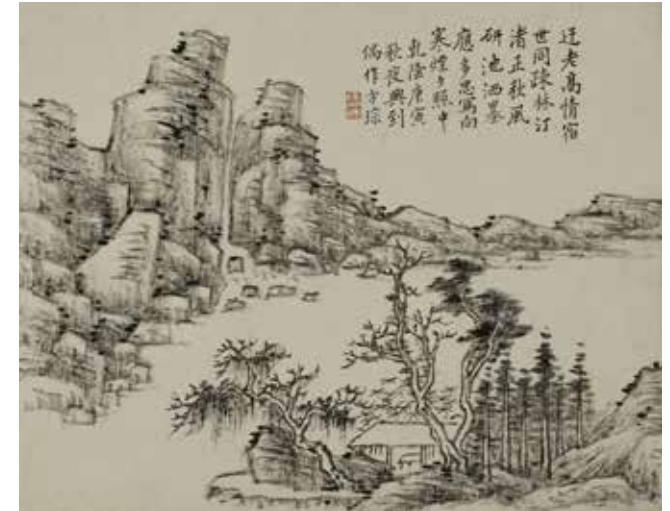
4 – Cong Fang, Paysage , 1770, encre sur papier, Paris, musée Cernuschi

Né à Anvers, Simon Denis (1755-1813) effectue l'essentiel de sa carrière en Italie, d'abord à Rome où il s'affirme comme l'un des meilleurs peintres de paysage, puis à Naples. Conformément aux principes académiques, la lumière du jour est utilisée pour identifier le moment de la journée. Le soleil, que l'on devine derrière le nuage bouchant le coin supérieur droit, a passé la ligne de montagnes encore embrumées et diffuse ses rayons sur l'eau, mettant en valeur une crique où s'activent des gens. La scène représentée, le départ pour la pêche, s'accorde avec les premières heures du jour. Le calme de la mer et la douceur des tons suggèrent une nature souriante, en harmonie avec les hommes. Relégué en arrière-plan, le Vésuve fumant paraît peu menaçant. Le pendant de cette œuvre, Vue prise au soleil couchant dans le golfe de Naples , non présenté dans l'exposition, permet d'embrasser de manière elliptique l'intégralité d'une journée.