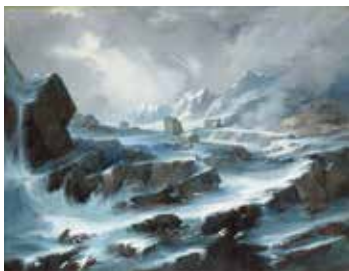
14 - Alexis Nicolas Noël, Le col du Grand-Saint-Bernard , 1835, huile sur toile, Musée des Beaux-Arts, Chambéry