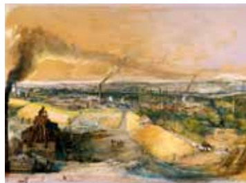
20 – Ignace-François Bonhommé, Mine de houille de Blanzy. Groupe de Theuré-Montmailot , vers 1860, aquarelle, Paris, Centre national des arts plastiques, en dépôt au Musée des Arts et Métiers - Cnam