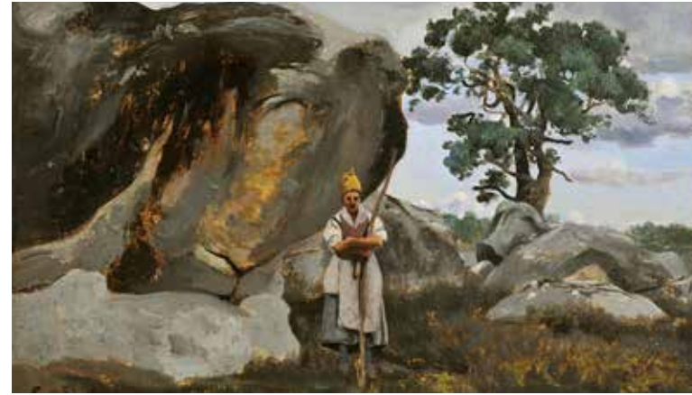
9 - Camille Corot, Paysanne en forêt de Fontainebleau , 1832, huile sur carton (marouflé), Senlis, Musée d'Art et d'Archéologie

Un dialogue à l'aspect théâtral entre l'arbre et le rocher est ici provoqué par l'artiste dans cette petite étude où la présence humaine paraît incongrue tant elle semble secondaire. Le rocher occulte de sa masse imposante la partie gauche du tableau alors que l'arbre, frêle et ébouriffé laisse passer la lumière. Dans les œuvres de jeunesse de Camille Corot (1796-1875), les personnages sont d'ailleurs intégrés au paysage après coup, dans l'atelier.