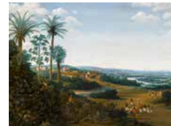
9 - Frans Post, « La demeure d'un labrador » ( planteur de canne à sucre ), 1650-1655, huile sur toile, Musée du Louvre, Paris