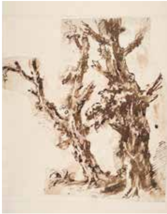
7 - Giovanni-Battista Piranesi, Étude d'arbres (titre forgé), 1764-1776, dessin à la plume, encre brune, lavis brun, Paris, École nationale supérieure des beaux-arts

L'artiste, par ses innombrables observations de terrain, se forme un répertoire « d'objets ». Il pourra ensuite les intégrer à une composition tout comme Giovanni Battista Piranèse (1720-1778) qui copie des arbres expressifs en « souffrance » aux branches dénudées (7). L'arbre dont Roger de Piles dès 1708 vante les qualités d'agrément est l'un des plus expressifs « ornements de la nature ». Il devient ainsi acteur du paysage allant jusqu'à la personnification à l'instar des premiers « portraits d'arbres » qui apparaissent au 19 e siècle comme celui d'Antoine-Louis Barye intitulé Le rageur (8). Symbole de la vie, il diffuse dans l'espace son branchage qui échappe à la gravité et apporte de la verticalité. Le rocher, qui joue un rôle équivalent dans ce couple vient en contrepoint (9). Puissant et imposant, il est ancré dans le sol et témoigne de l'histoire de la terre. L'assemblage peut alors s'associer au reste des éléments naturels comme l'eau, le ciel pour former l'architecture du paysage en un tout « agréable et pittoresque ». La conception du paysage est rendue possible par la connaissance accrue des éléments naturels qui le composent mais également par la prise en compte de leur transformation potentielle face aux caprices du temps, observable en plein air (pluie, vent) (10).