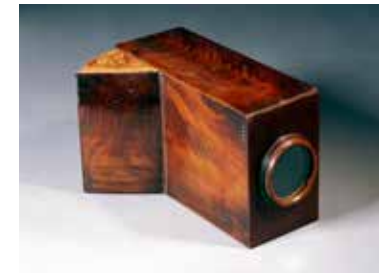
4 - Jaan-Baptiste Porta, Chambre noire portative, 1750 , Paris, Musée des arts et métiers

À la manière de Joseph Vernet un siècle plus tôt dont les vues des ports français valorisaient l'investissement maritime du pouvoir royal, François Bonhommé (1809-1881) reçoit plusieurs commandes du Second Empire (1852-1870) illustrant le tournant industriel du pays. Ici, ce sont les premiers temps de l'extraction minière dans la région du Creusot qui sont documentés. Ainsi, en raison de l'abondance du charbon, les mines à ciel ouvert suffisent. La composition joue sur l'imbrication du paysage industriel naissant avec les espaces ruraux alentours : champs et bosquet côtoient les puits dont les teintes beiges et rouges tranchent avec le vert tendre environnant. L'emploi d'une perspective panoramique offre au regard la campagne éventrée par les puits tout autant que les cheminées crachant une fumée noire. Prises dans ce chaos industriel, les figures humaines fourmillent d'une activité que rien n'arrête, pas même le danger du feu qui menace à droite. La vibration des formes propre à l'aquarelle redouble la volonté du peintre de rendre un paysage en mutation