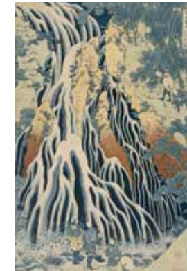
2 - Katsushika Hokusai, La cascade de Kirifuri sur le Mont Kuro-kami dans la province de Shimotsuke , 1833, Musée national des arts asiatiques Guimet