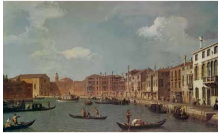
3 - Giovanni Canal dit Canaletto, Vue du canal de Santa Chiara, à Venise, vers 1730 , huile sur toile, Paris, Musée Cognacq-Jay