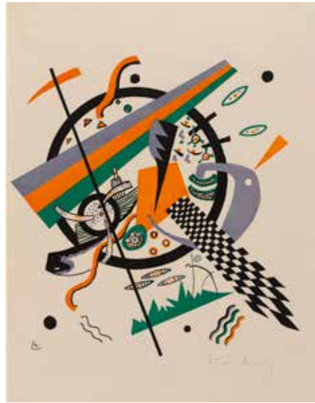
25 - Vassily Kandinsky, Petits Mondes I , 1922, estampe en couleur, Paris, Centre Pompidou, Musée national d'art moderne / Centre de création industrielle