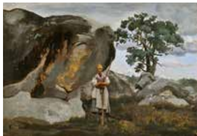
11 - Camille Corot, Paysanne en forêt de Fontainebleau , 1832, ; huile sur carton (marouflé), Musée de Senlis

En observant le tableau et les formes qui le composent, on voit se dessiner les lignes de force (diagonales, verticales, horizontales, lignes courbes ou serpentine...) qui orientent le regard du spectateur. Elles indiquent comment l'artiste a voulu qu'il découvre l'espace peint, hiérarchisant les différents éléments représentés.