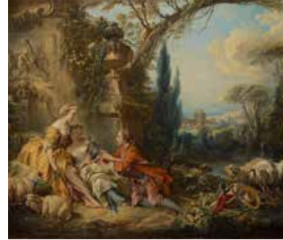
10 - François Boucher, Les Charmes de la vie champêtre , vers 1735-1740, huile sur toile, Paris, Musée du Louvre

Le peintre flamand Paul Bril (1553 ou 1554-1626) rencontre un grand succès à Rome au tournant du 17 e siècle. Les paysages de sa production se caractérisent par une maîtrise de la composition en accord avec le goût naissant pour un ordonnancement accru s'éloignant du maniérisme* du 16 e siècle. La scène de ce tableau est ainsi solidement encadrée à droite et à gauche par un arbre imposant et par une ruine. Deux diagonales convergent depuis les coins supérieurs vers le centre qui délimitent plusieurs plans successifs soigneusement mis en valeur par un jeu de lumière. Le caractère construit - théâtral - se retrouve dans le collage architectural d'imposants vestiges produisant un effet pittoresque qui se veut toutefois en adéquation avec la dignité du sujet, à savoir une scène de l'Ancien Testament.