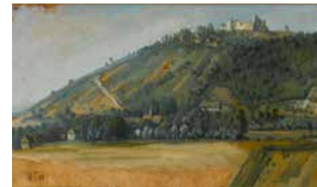
22 – Alexandre-François Desportes, Étude de paysage , vers 1692-1700, huile sur papier, Sèvres, Manufacture et Musées nationaux, en dépôt à Lille, Palais des Beaux-arts