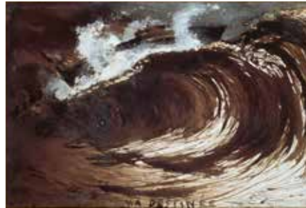
4 - Victor Hugo, Ma Destinée , 1857, plume, encre brune, gouache sur papier vélin, Paris, Maison de Victor Hugo

Une révolution se produit à la fin du 19 e siècle avec l'apparition successive de la photographie et du cinéma. Cette rupture importante dans la pratique et la pensée de la représentation oblige la peinture à prendre une nouvelle direction. Elle est amorcée par l'esthétique impressionniste ou les séries de dessins imaginaires aux formes étranges teintés de sépia* que l'écrivain Victor Hugo (1802-1885) réalise dès 1850 (4) et se diffuse dans les milieux artistiques et intellectuels. Certains artistes, théoriciens des formes et des couleurs tels Wassily Kandinsky (1866-1944), établissent de nouvelles règles au début du 20 e siècle afin d'échapper au modèle qu'impose le réel. Il propose aux artistes de se libérer des impératifs liés à l'imitation (5-6-7). Dès lors, le paysage perd de sa clarté au profit d'espaces nouveaux qui défient la logique et qui ne sont plus nécessairement issus du visible mais peuvent naître à l'opposé, de la force de ses impressions intérieures, de sa psyché. Les pensées du peintre peuvent s'exprimer dans l'autonomie des formes et des couleurs au cours d'une phase d'expérimentation qui aboutira à l'abstraction puis au surréalisme. Quelques traces de brosse aux teintes bleutées et mauve peuvent devenir champ infini chez Joan Mitchell (9) ou site onirique inquiétant sous le pinceau d'Yves Tanguy (8).