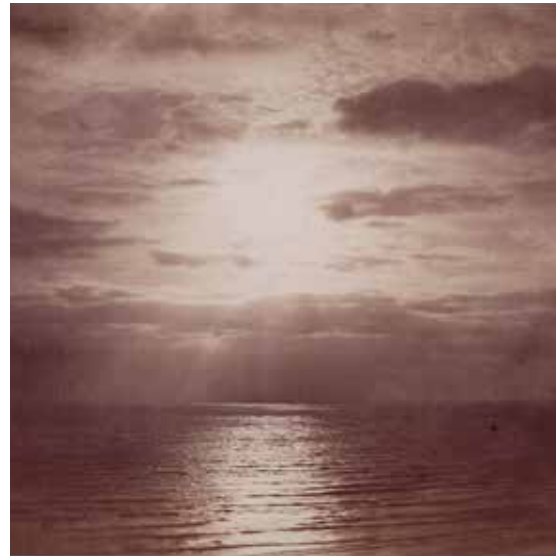
3 - Gustave Le Gray, Effet de soleil dans les nuages - Océan , vers 1861, épreuve sur papier albuminé à partir d'un négatif sur verre, Paris, Musée d'Orsay