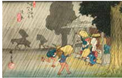
16 – Utagawa Hiroshige, Suhara. Série des Soixante-neuf étapes du Kiso Kaidō , 1800-1869, estampe, Musée national des arts asiatiques Guimet, Paris