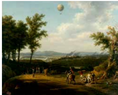
2 - Louis-François Lejeune, Siège et embrasement de Charleroi, le 7 Messidor An II (25 juin 1794) , huile sur toile, 1795, Paris, Musée de l'Armée

La scène biblique représentée ici reprend un dispositif classique des scènes de batailles tirées de l'histoire. Au centre et de face, Josué se singularise de la masse des soldats par une composition qui fait la part belle au chef militaire s'illustrant par l'héroïsme de ses actes. Le paysage n'est ici qu'un accessoire au service de la scène représentée. Le promontoire rocheux qui occupe le coin supérieur droit sert ainsi à rendre visible Moïse encadré de deux autres figures dans l'accomplissement du commandement divin : Josué vaincra les Amalécites tant que le prophète gardera les bras levés.