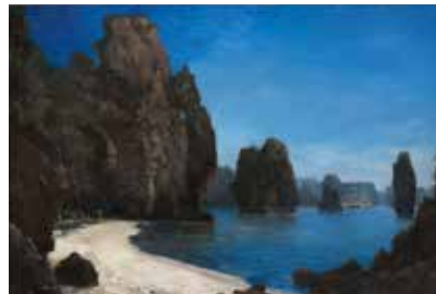
12 - Gaston Roulet, La baie d'Along (Tonkin), le cimetière des transports français « Gironde » et « Nièvre » , 1885, huile sur bois, musée de l'Armée, Paris