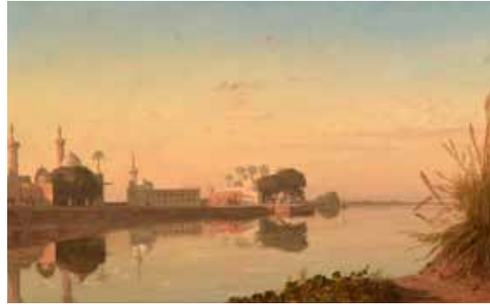
7 - Prosper Marilhat, Vue du Nil de Basse Égypte , vers 1840, huile sur bois, Beauvais, Musée de l'Oise

Ailleurs n'est toutefois pour certains peintres pas toujours à la hauteur des projections nourries par l'imaginaire. Gaston Roulet (1847-1925) ne trouve ainsi pas en Indochine « les effets de couleurs, que tout le monde croit généralement devoir exister là-bas. » 4 Il parvient néanmoins par l'emploi de teintes franches à rendre compte de la nouveauté des sites observés (9).