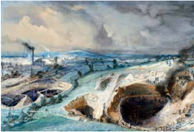
2 - Ignace-François Bonhommé, Mines à ciel ouvert de Blanzy, Saône-et-Loire, 1857 , aquarelle, Paris, Centre national des arts plastiques, en dépôt au Musée des Arts et Métiers - Cnam