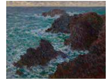
7 - Claude Monet, Les rochers de Belle-Ile, la Côte sauvage , 1886, huile sur toile, Musée d'Orsay, Paris