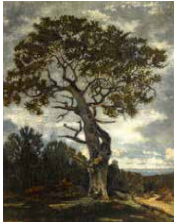
8 - Antoine-Louis Barye, Le rageur , vers 1850-1860, huile sur toile, Fontainebleau, Mairie de Fontainebleau