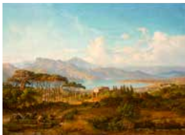
15 - August Lucas, Paysage d'Italie , 1852, huile sur bois, Musée du Louvre, Paris

La perspective atmosphérique : ce système de perspective utilise les couleurs ainsi que la netteté et le flou pour signifier la profondeur de l'espace