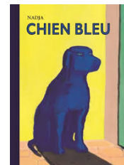
Chien bleu Nadja l'école des loisirs