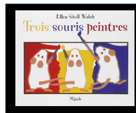
Trois souris peintres Ellen Stoll Walsh Mijade